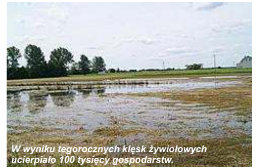
W wyniku tegorocznych klęsk żywiołowych ucierpiało 100 tysięcy gospodarstw.